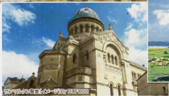
サンマルタン聖堂(イメージ) By BUF088