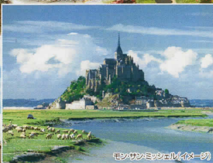
モンサンミッシェル(イメージ)