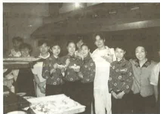
さぬきのカレーもハオチー（おいしい）