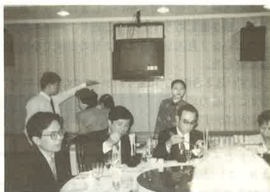
うどんのお味はいかがですか？