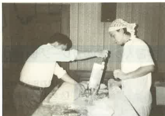
プロによる実演中

会館の中国人スタッフ約20名も、一緒になって麺づくりに参加して団員とともに麺を茹で洗うなど、言葉は通じなくても目と心で、90