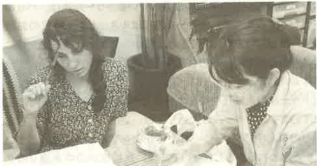
◀ アットホームなさぬきっ子式日本語教室