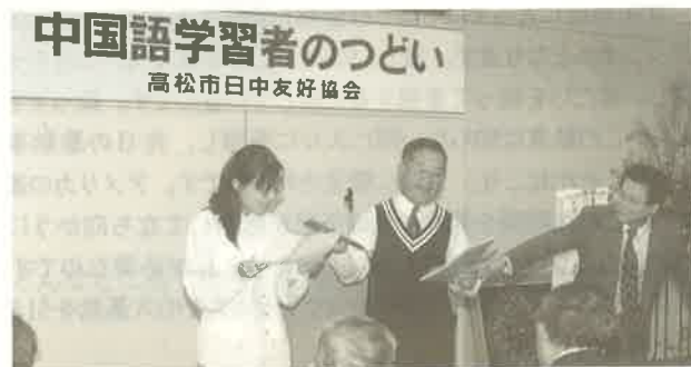
「つどい」で中国女性と一緒に歌う出場者