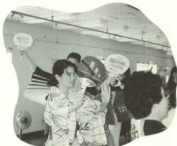
盆おどりの練習風景

行政や企業の関係で来高しても、それだけがすべての交流とは言えません。心が開放されるのは、民間交流というのでしょうか、個人や団体とのふれあいもとても重要です。過去の写真をみせていただきましたが、栗林校区の盆おどりなどに参加したり、多肥北公園での桜の植樹祭では、まさに南昌を代表して参加しているのもありました。また、行政研修生が講師で、地区公民館活動で、中国語を教え、そのメンバーで三峡下りをしたり、企業研修生では、女性が大変多く来ている写真もありました。国際交流フェアなどの行事にも積極的に参加してきております。そして、弦打小学校と育新学校との相互の訪問交流や作品交流は、まさに特筆されるものでしょう。南昌からは、企業使節団や教育使節団も派遣する回数が増えてきています。