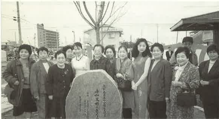
チャイナドレスで桜の植樹祭に参加の南昌人

7月1日・2日に、丸亀町商店街のレッツで、南昌市写真展が開催されます。南昌市も例にもれず、経済発展は、飛躍的に進んでおり、高松市国際交流室では、古い文化や歴史と発展めざましい都市景観などを展示し、また、写真以外の陶器や絵画などの文物の展示もあります。中国の女性たちも参加して、中国服で、お茶でお接待したり、私は、私で、書を即興に書いたりする芸などを披露し、来観者に楽しんでいただきます。もちろん、BGMは、中国の歌です。どんどん来てください。丸亀町レッツが、2日間南昌市内にあると錯覚するような国際交流室の企画に、私たち南昌人は、全力投球いたします。