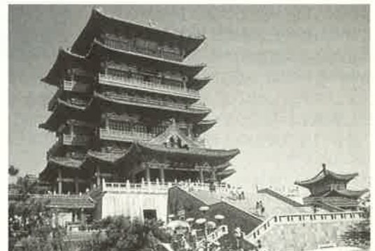
江南三大樓閣の一つ滕王閣