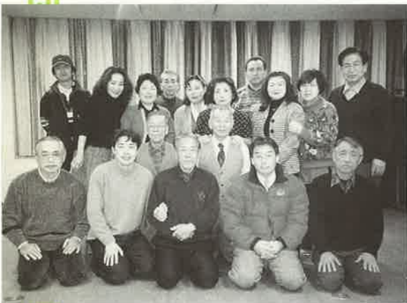
書道を通じて市民交流

南昌市は... 人口 4,078,900人 面積 7,402km 2 (高松市の38倍) 年間平均気温 17.6℃ 年間降水量 1,314mm 年間日照日数 2,078時間 の都市です。