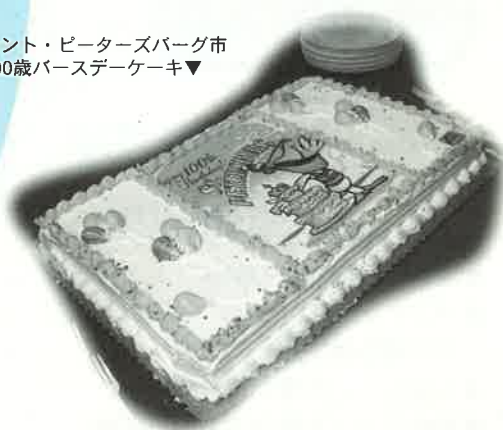
セント・ピーターズバーグ市 100歳バースデーケーキ▼