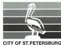
CITY OF ST.PETERSBURG

両市の国際交流の輪が大きく広がることを願い、セント・ピーターズバーグ市に別れを告げ、ラスベガス、グランドキャニオン、サンフランシスコを周り、帰国の途に着きました。