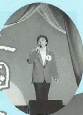
プロ顔負けの パフォーマンス