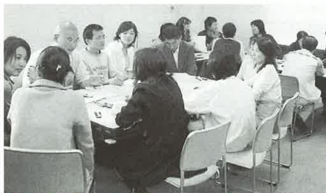
▲「会話練習」や「個別の疑問に答える」フリークラスの様子