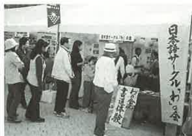
▲書道体験コーナーが大人気!「かがわ国際フェスタ2004」にて

定期のフリークラスは土曜日13時30分から(ちらし等でご確認ください)、ボランティアの研修は月二回、いずれも女性センターにて。他に、学習者とボランティアの都合があえば、個別にも対応します。