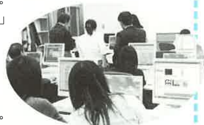
「わ」の会研修会～日本語「共有」のためのIT実習▲