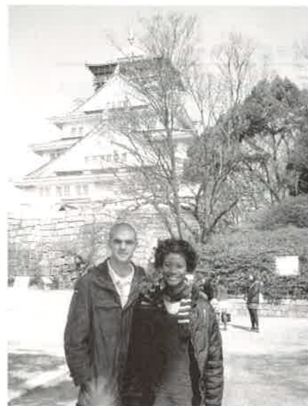
ジャマイカ生まれ。大学からアメリカへ。 そこでご主人と出会い結婚。2008年に来高。 現在は英会話の先生として活躍中。

高松の生活は私にとって、とてもユニークな経験です。美しい自然、美味しいうどん、花見などは新鮮でした。ここに来てまず、道や空気がきれいだなあと感動し、高松の全てを知りたいという気持ちで頭がいっぱいになりました。そして私の冒険は始まったのです。最初の一週間は、周りの人からの興味本位の視線が気になりました。でもそういう人達も、とても親切だし私のお願いも喜んで進んで手伝ってくれます。ある日、