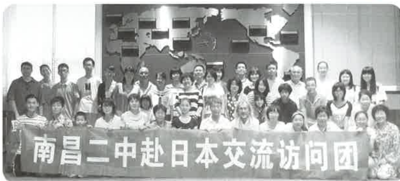
ホストファミリーのみなさんと