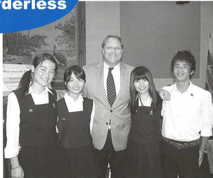
セント・ピーターズバーグ市派遣高校生親善研修 ▶ P2