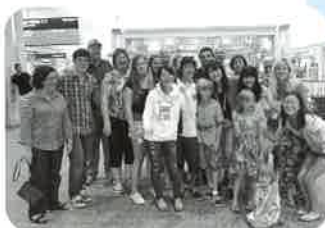
ホストファミリーのみなさんと