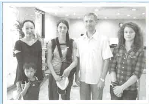
ホストファミリーのみなさんと

今年も穴吹ビジネスカレッジの日本語研修の一環として、ロシアのカムチャツカより3名の留学生がやって来ました。今年は14、15、16歳の女子中学生ですが、見た目はもう可憐なレディ。未曾有の猛暑で体調など心配もありましたが、研修に遊びにと来高を楽しめた様子でした。2日間のホームステイに参加した子も、残念ながらそうでなかった子もいましたが、できる限りの思い出作りをし、有意義な滞在となったことでしょう。慣れない土地で彼女らは精一杯頑張りました！