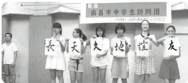
歓迎夕食会で書道を披露