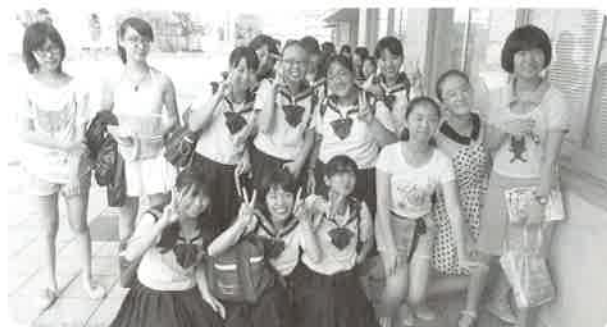
高松第一中学校訪問