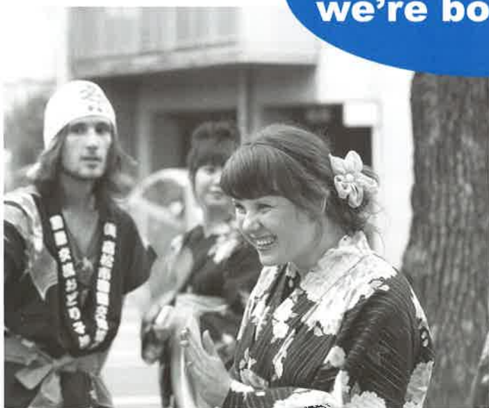
国際交流おどり子連 ▶ P4