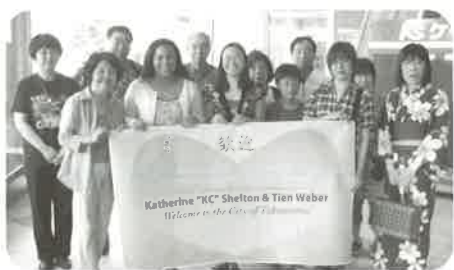
ホストファミリーのみなさんと