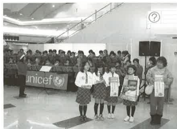
ユニセフハンド・イン・ハンド募金活動