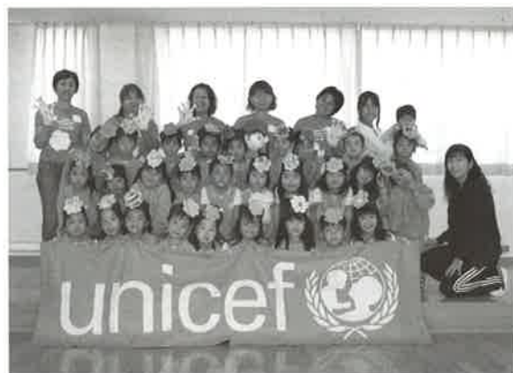
世界手洗いの日イベント 光華幼稚園にて

ユニセフ(国際連合児童基金)は、「世界の子どもの笑顔のために」活動を続けています。ユニセフへの支援活動を、日本一狭い香川の地から広げていきたいと思っていますので、一層のご理解とご支援を賜りますよう、本紙面をお借りしてお願い申し上げます。