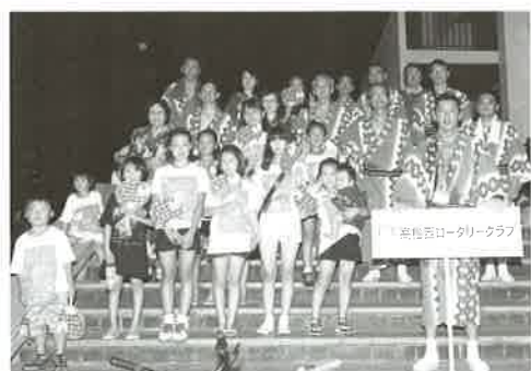
平成25年さぬき高松まつり総おどりに韓国:天安市の子ども達と参加しました