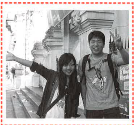
トゥール市派遣親善研修