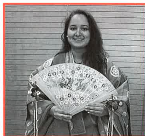
姉妹都市からこんにちは