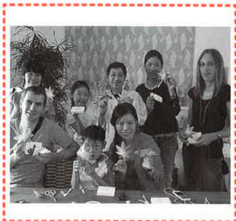
さぬき探訪【和三盆と折り紙体験】