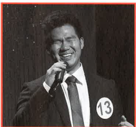
第18回外国人のど自慢・お国自慢大会