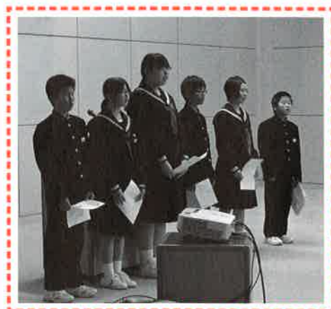
姉妹・友好都市親善派遣研修生報告会