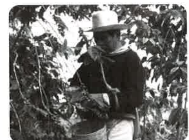
コーヒーの実を収穫