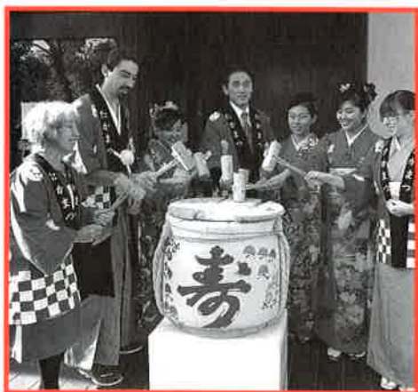
第19回さぬき国際交流お正月会