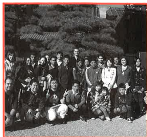
国際交流 秋のお茶会