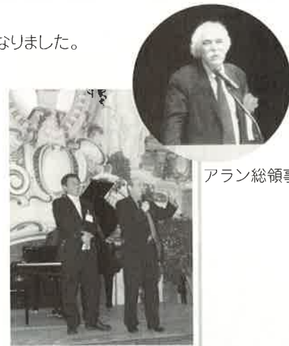
トゥール市庁舎にて歓迎夕食会