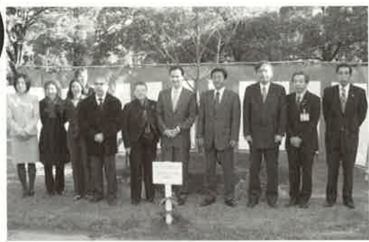
中央公園にマロニエを記念植樹