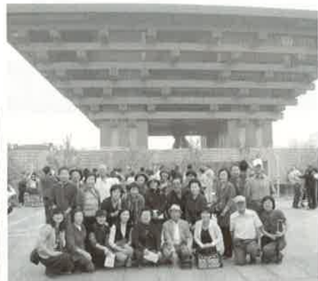
上海・蘇州コース