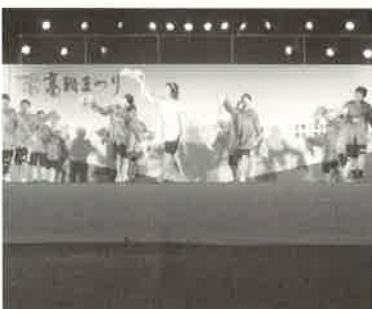
高松市初の中国人ヤングを披露しました。