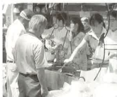
アジアンDAY・県・市の交流イベントを通じて中国の小吃を紹介した。