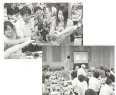
さまざまな集会を通じて華僑華人・留学生、日本人との交流を深める。

そのほか、「水利用技術・水質浄化技術」の中国への応用、香川を中国各地への紹介活動を展開していきます。本会の活動に賛同する方はぜひご協力をお願いします。