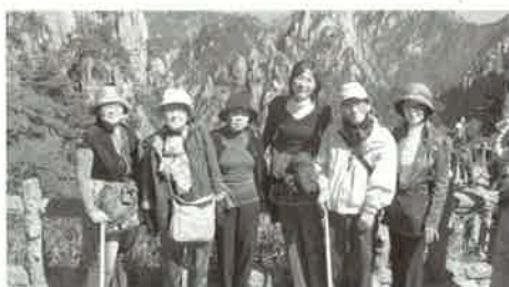
景德鎮・黄山・上海コース